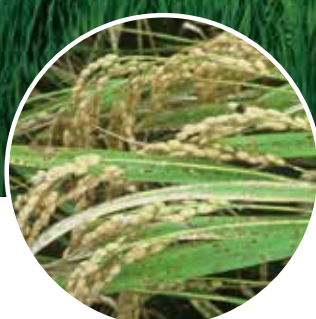
穂枯れ(ごま葉枯病菌)