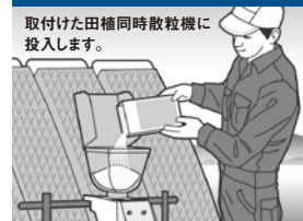
田植同時処理は、田植同時散粒機で散布。