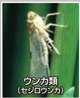
ウンカ類 (セジロウんか)