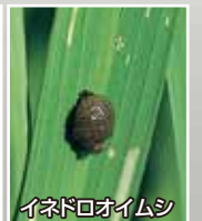
イネドロオウムシ