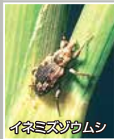
イネミスジウムシ