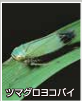
ツマダロヨコバイ