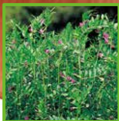
ガラスノエンドウ