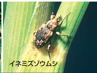
イネミズゾウムシ