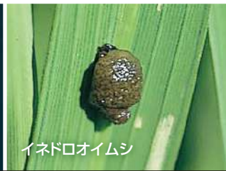
イネドロオイムシ