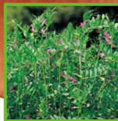
カラスノエンドウ