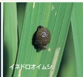
イネドロオイムシ