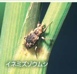
イネミスゾウムシ