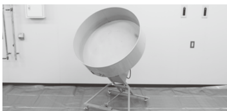
種子コーティング機