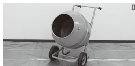
コンクリートミキサー