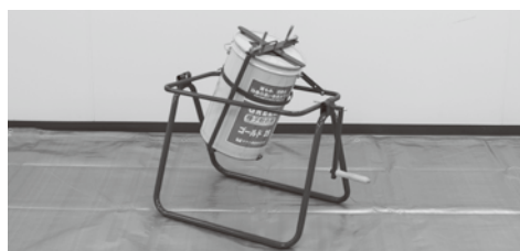
土壌・肥料混和機(は種前(浸種前)処理のみ)